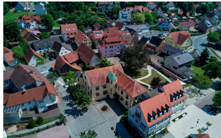
Büro der ILE Kahlgrund-Spessart