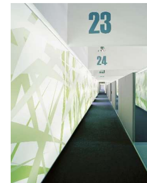
Architekten ATP, Foto: ATP architekten ingenieure