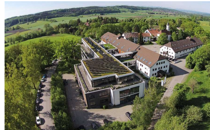
Produktions- & Verwaltungsgebäude „Gut Delling“ in Seefeld (standortportal.bayern)

Praxisbeispiel: TQ -Systems - „Gut Delling“, Seefeld